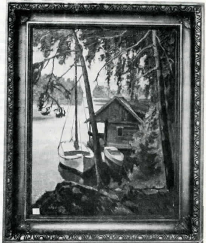
Auer: Veneitä valkamassa.

Taiteilija Auer luonnehtii kaltaisiaan sanalla »haputti». Sana ei ole sellaisenaan varsin sanova, ja sen merkitys rajoitetulla käyttöalueella tuntuu melko yksipuoliselta. Kuitenkin sen nojalla, että taiteilijaa itseään se miellyttää, vaikkapa se merkitsee vain lyhimmiten huimapäätä , rohkenen sitä käyttää taiteilijasta itsestään eräin puolustuksin. Jos eliminoi sanalta sivuvivahdukset, merkitsee haputti Auerin käyttämänä samaa kuin olla oma itsensä . Tätä juuri