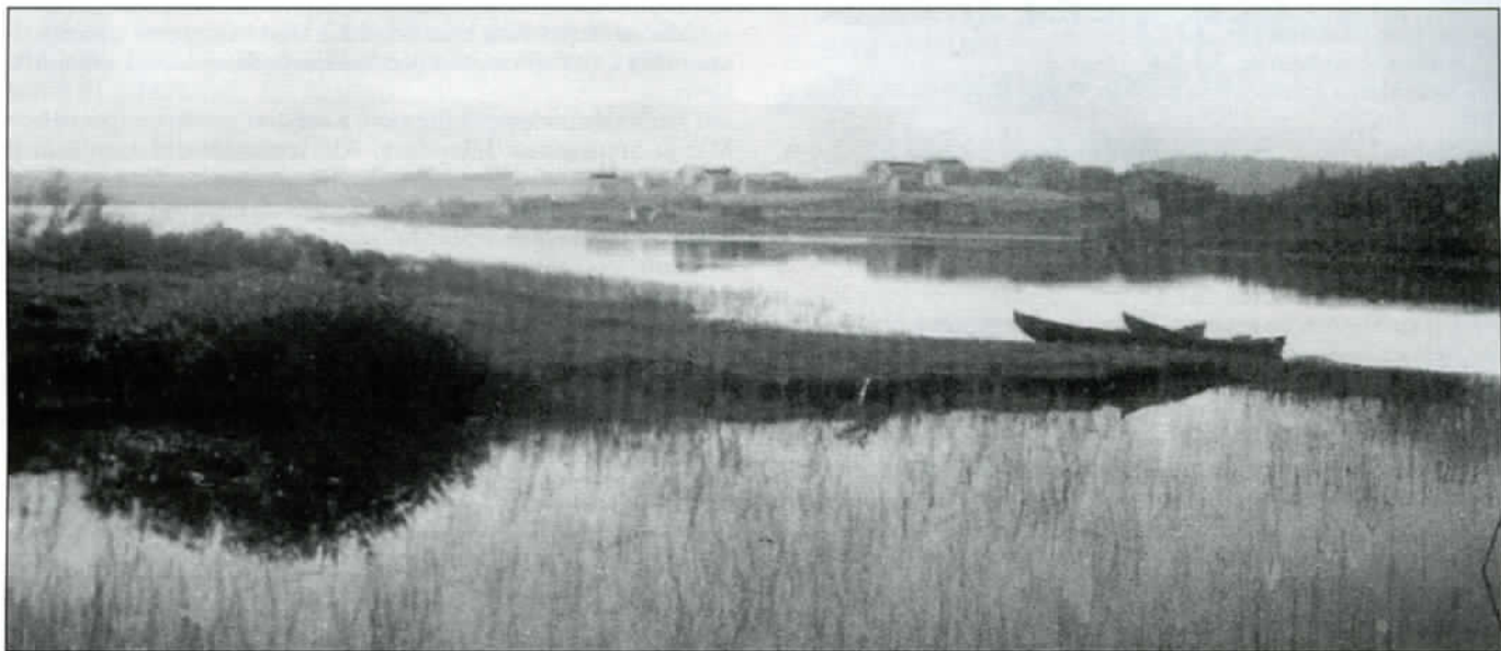
Vanhaa Kostamuksen kylää Saviniemen ja Vatalan välisen salmen sillalta Saviniemen puolelta nähtynä. Taustalla Vatalan taloja.