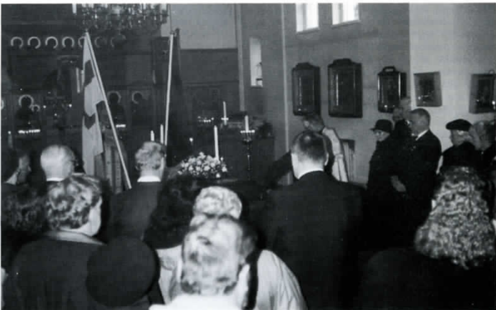
Siunaustilaisuus Profeetta Elian kirkossa.