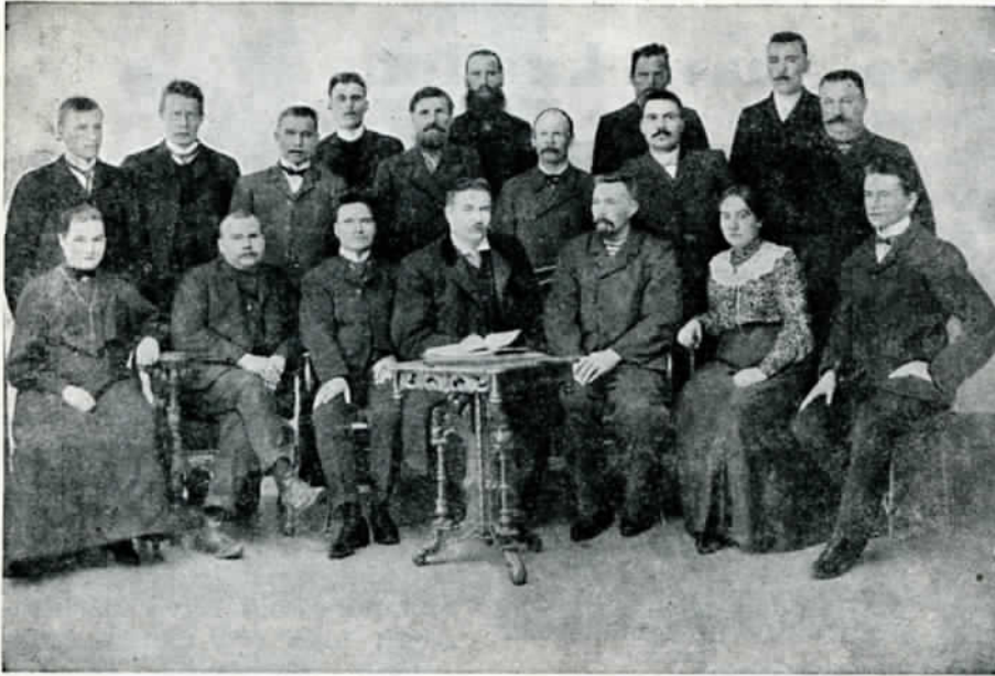
Vaasassa kokoontui huhtikuussa 1906 joukko vienankarjalaisia neuvottelemaan Vian Karjalaisten Liiton perustamisesta. Kuvassa kokouksen osanottajat.