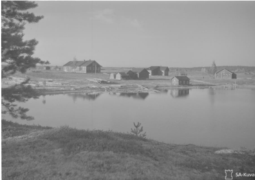
Tällä ja seuraavalla sivulla: kuvia Akonlahdesta 1941.