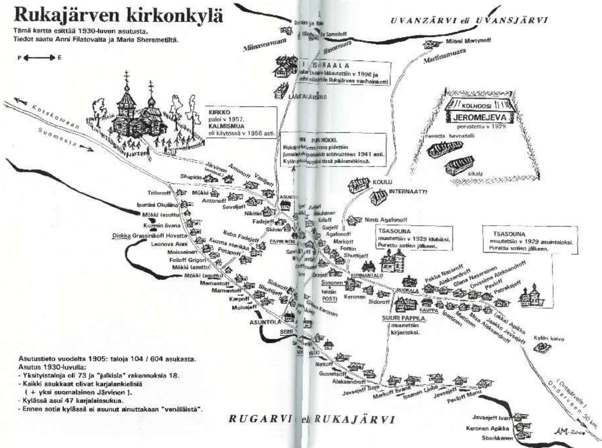
Alla: Rukajärven kartta, julkaistu Karjalan Heimon numerossa 5-6/2000.