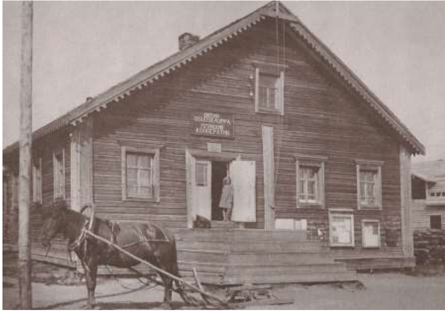
Uhtuan osuuskauppa 1927-1937.