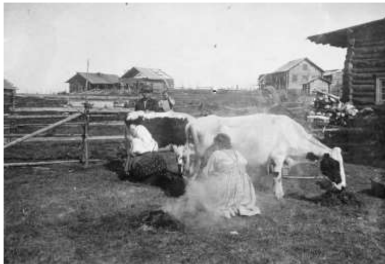
Kivijärven kylän lypsäjä, vuosi 1927.

Yleensä rajaseutukylissä ja aivan välittömässä rajan läheisyydessä on tavattoman vaikeata päästä oikeata ainesta tapaamaan, sillä vahvis- tettu patrullivartiointi ja patrullien liikuskeleminen – salakyttääminen, on sikäli voimaperäistä, että voi millä hetkellä hyvänsä joutua aavis- tamattomiin selkkauksiin – huolimatta kaikesta varovaisuudesta, etenkin kun käynnit ovat näin äkkiä tapahtuvia. Mutta jos ne jo aikai- seen keväkesästä saisi valmistettua, niin huolimatta tiukkaan pingoi- tetusta poliittisesta tilanteesta ja terroristista löytyisi pelkäämättömiäkin ystäviä, joiden avulla kykenisi toimimaan. Mutta nykyoloissa kansa on taas sikäli pelon ja kauhun vallassa, että järkevimmältäkin ainek- selta hermot alkavat höltyä. Ja tuskinpa paljon mitään kykenee ai- kaansaamaan.