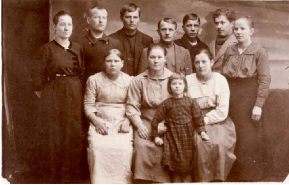
Kuusenvaaran kylän rahvasta Lieksassa 1924.

kentaa. Paanajärven pappi kuuluu käyneen äskettäin kylässä ja on toimitannut joitakin kertoja Jumalanpalveluksia yksityisessä huoneustossa.