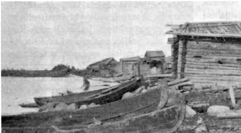
Rugarven (Rukajärven) kylän venevalkama pohjois-Aunuksessa. Touonpano-lehden v. 1907 numerosta 4-5. Peräisin Sampo-tietokannasta.

Kun yllämainittujen lisäksi sanotuilla paikkakunnilla toimivat puutaratrustit tuottavat huomattavissa määrin elintarpeita ja yms. ensihädän taloustarvikkeita, niin suurempaa puutetta elintarpeista yms. rahvaan keskuudessa ei ole nykyisin huomattavissa. Päinvastoin niille taloille, joille on enemmän omaa työvoimaa, elintarpeita jauhojen muodossa karttuu aina ylijäämiin niin, että on eräissä tapauksissa kymmeniäkin säkkejä jauhoja mädännyt monta vuotta istuessaan käyttämättä.