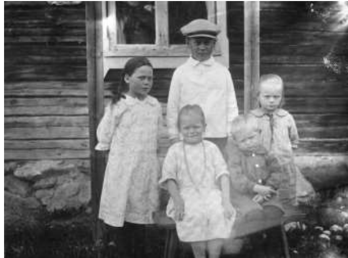
Rukajärven suunnan lapsirukat Kuhmossa v 1926. Peräisin Sampo-tietokannasta.

On muistettava, että Uhtuan piirikunnassa – kuten yleensä kaikkialla Vienan Karjalassa – niin nykyisin kuin vanhoinakin aikoina – mainittu järjestely on huomattavammin takapajulla ja sairashoitoa ja apua harvemmin saatavissa. Esim. Jyskyjärvellä kylläkin on välskärien asema, mutta muualla laajassa kyläkunnassa sitä missään ei ole.